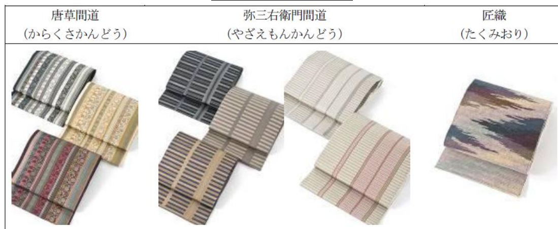
図表 2 同社製品

当社工場内の展示場スペースを活用し、工場見学を中心とした講義を交えた消費者への直接販売。同社工場で帯の製造工程を「教える」または「伝える」ことで、その伝統的な技法や価値に対して消費者の理解を深めることができ、購買に結びつくものと考えている。同社では、一般の方がいつでも工場見学できるよう体制を整えている。また、同社ホームページ上では、博多織の製造工程の動画も公開。インターネットによる販売も行っている。