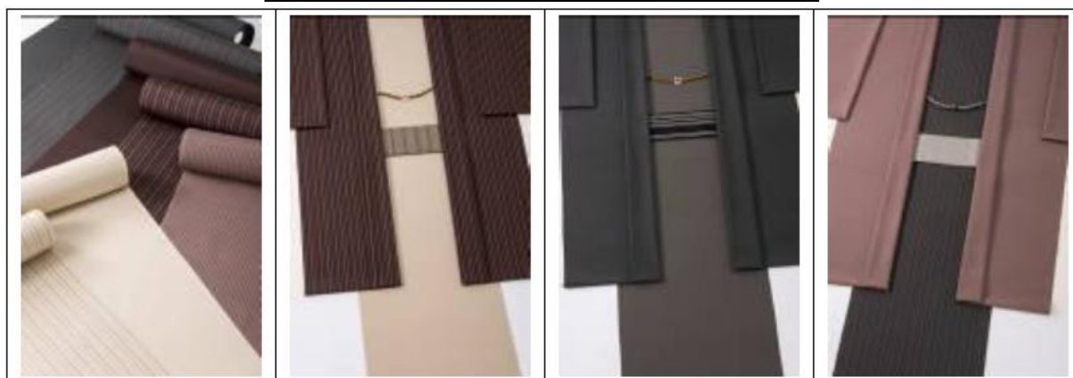
図表4 販売開始を開始した「男きもの」

男きもの販売を目的とした店舗展開として、直営の男きもの専門店「SAMURAI」1号店(銀座本店)を平成26年4月17日に東京都中央区銀座五丁目・歌舞伎座前に、同年4月30日にフランチャイズ店舗(京都店)を京都市東山区祇園町南側・南座傍に出店。企画・製造・販売を当社で、仕立てを(株)きものブレイン・日本和装ベトナム社(NIHONWASOU VIETNAM Co.,Ltd.)が行うことで縫製・流通経費の最少化を図り、高品質の男きもの低価格での提供を展開できよう。なお、この男きものオリジナルブランドである「KATANA」は、40代以上をターゲットとし、「格好良いおとなの男」をキーワードにエクゼクティブ層の新しいファッションとして提案していく意向。素材は正絹(オールシルク)・「きものはオーダーメイド」という原則を変えることなく、きもの・羽織・帯・長襦袢・仕立一式の構成である。