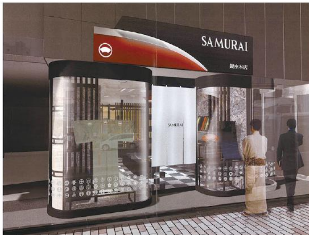
図表 6 直営の男きもの専門店「SAMURAI」1号店(銀座本店)