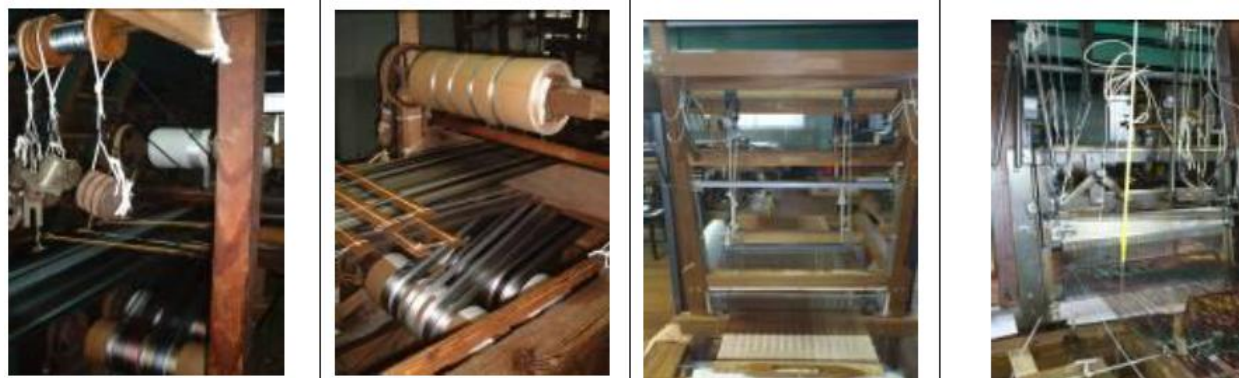
図表 3 手織り機～各機で違った帯ができあがる～

工場内には、手織り、機械織り合わせて 20 台の機(はた)を保有。機を変えることで、一人の職人が数種類の帯を製造することが可能である。特に、手織りの機を数多く保有し稼働させていることが特徴である。同社製造の手織りの帯の特徴は、「絹鳴り」の音にあるものと考えている。この「絹鳴り」の音と独特の結び味は、密度の高い経糸(たていと)と太い緯糸(よこいと)、さらに上質な絹糸ゆへの醍醐味と言える。武士や庶民の実用の帯として発展した博多織は、今ではデザインも多様化され、使いやすく、結びやすく、そして美しい帯として製造されている。