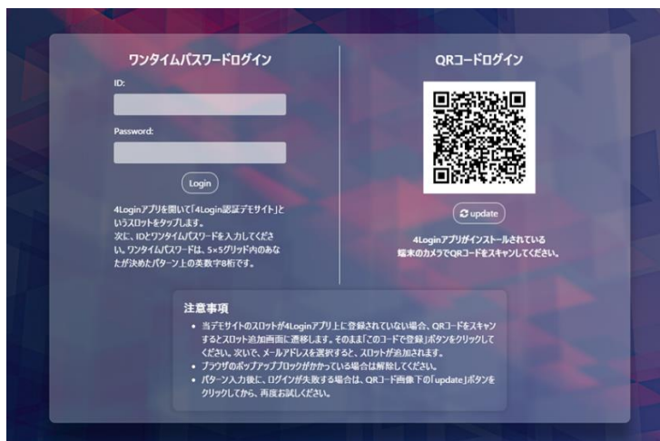
QRコードログイン用画面の一例